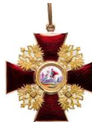
Орден Св. Александра Невского. XVIII век.

В 1725 году Екатериной Великой был учрежден орден Святого Александра Невского, наиболее почитаемого русского воина, ставшего полководцем в 18 лет, а в 20 выигравшего знаменитую Невскую битву, для награждения офицеров и генералов за крупные военные успехи и отличия. Среди кавалеров ордена – цвет военачальников российских: генералиссимус Александр Суворов, фельдмаршал Михаил Кутузов, адмирал флота российского Федор Ушаков. Примечательно еще, что орден Александра Невского – единственный дореволюционный орден, возрожденный в советское время – в 1942 году. Его статус очень высок. Он вручался командирам за выбор «удачного момента для внезапного, смелого и стремительного нападения на врага и нанесения ему крупного поражения с малыми потерями для своих войск».