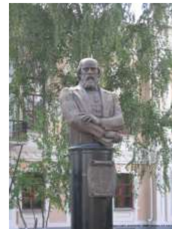
Памятник Смолину Д.И.

у здания заводоуправления ОАО «Кургандрожжи»