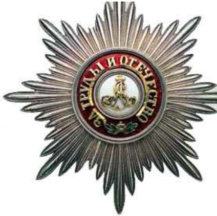
Звезда ордена Св. Александра Невского.