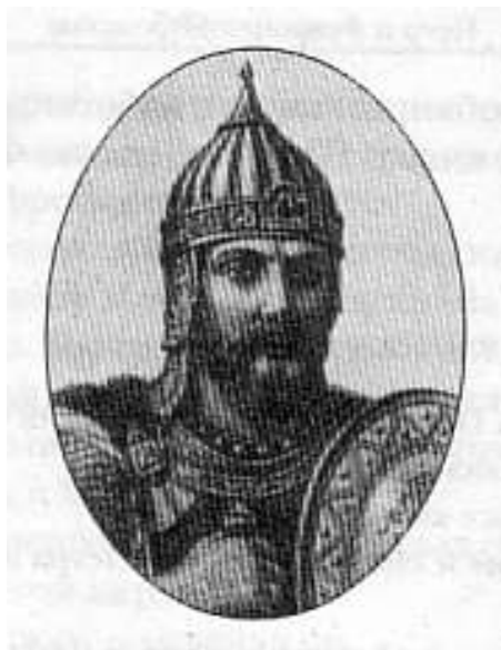
Великий князь Александр Ярославич Невский (30 мая 1220 г. – 14 ноября 1263 г.)

Главный храм города Кургана носит имя мужественного русского князя Александра Невского. Прославленному князю Александру Ярославичу было отведено всего сорок три года земной жизни, но эти годы оказались насыщенными важнейшими событиями. Мудрый политик и талантливый полководец, вызывавший восхищение даже у своих противников, князь Александр правил Русью в тяжелейшее время монголо-татарского ига. В XIII веке он трижды спасал